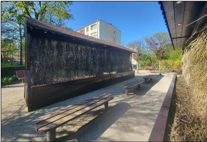
Fotografie stanu istniejącego tężni solankowej: